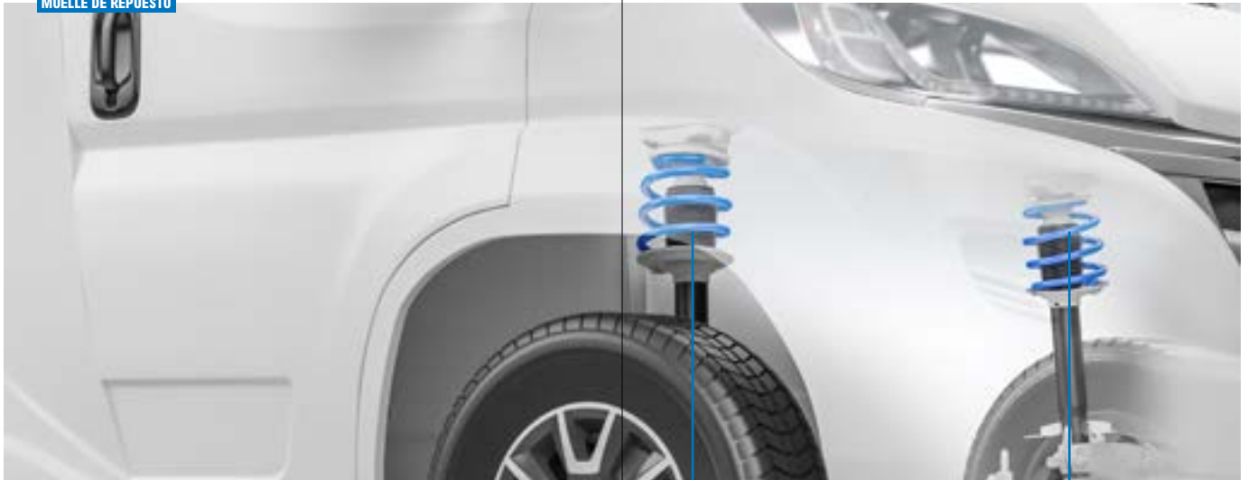
MUELLE DE REPUESTO