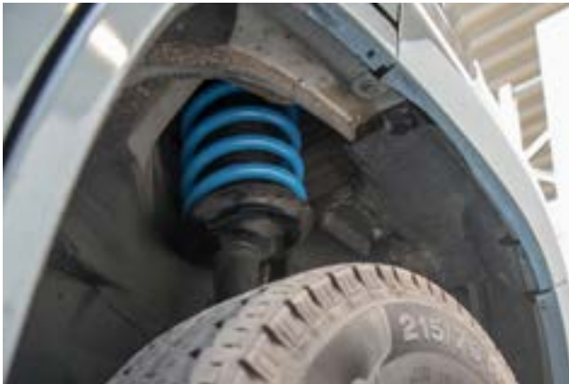
CONTENIDO DEL KIT: SUSPENSIÓN CON MUELLES HELICOIDALES